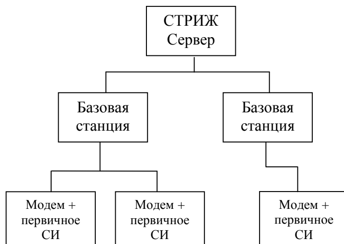
Рисунок 1. Структурная схема систем измерительных автоматизированных контроля и учета энергоресурсов «СТРИЖ Телематика»